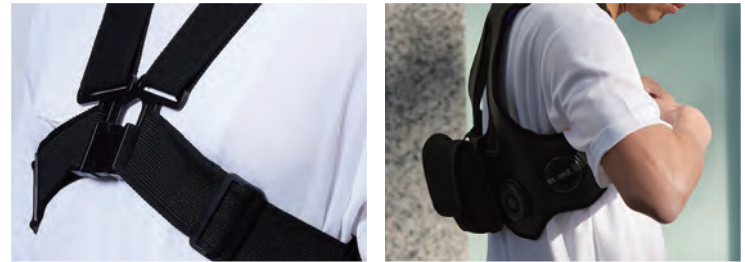
アジャスターと調整ベルトで幅広い体型にフィットします