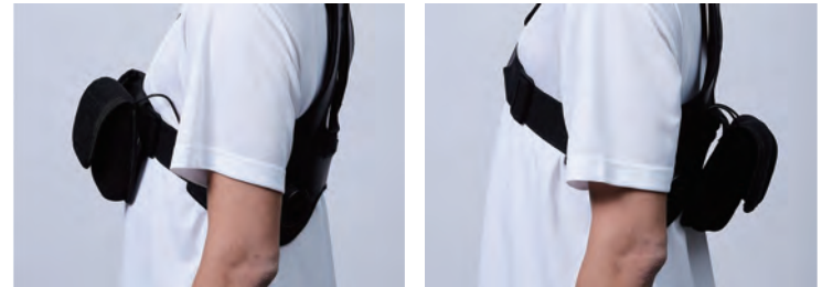
モバイルポケットは前後に装着が可能です