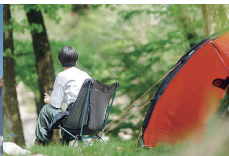
アウトドア・レジャー