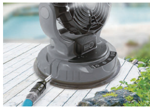
水道直結 水道からホースに繋いで給水 ※水道直結時はミストスイッチはOFF