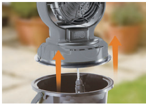
ポンプ バケツの水をポンプで給水